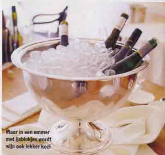
Maar in een emmer met ijsblokjes wordt wijn ook lekker koel

hebt gevraagd. Maar nu die fles dus. Er is zeker wat te zeggen voor efficiëncy en zo, maar romantisch is het niet. Hoewel? De aloude methode om je flessen een dag te voren in het stroompje langs de picknickweide te leggen, werkt perfect. Of de butler vragen de fles in een natte doek te wikkelen en rondjes te rennen. CO 2 -neutraal ook nog.